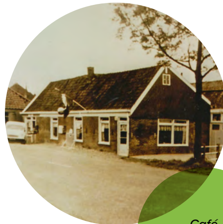
Café "het Haasje"

De Wildebras is het dorps huis van Zwaagdijk-West en speelt een centrale rol in de gemeenschap. Het gebouw biedt diverse accommodaties en voorzieningen, waaronder een grote zaal met bar, een biljartzaal, en buitenspeelruimtes zoals een natuurspeeltuin, een voetbalveld en een jeu-de-boulesbaan. Het dorps huis wordt gebruikt voor evenementen, sportactiviteiten en sociale bijeenkomsten. Naast de activiteiten georganiseerd door het Wildebras-bestuur, zijn er ook initiatieven van de 13 verenigingen die gebruikmaken van de faciliteiten. Het gebouw is tevens te huur voor privégebruik voor dorpsbewoners. Regelmatig worden er evenementen georganiseerd zoals pubquizzes, toneelvoorstellingen, en activiteiten op feestdagen, waaronder Koningsdag en Sinterklaas. Maandelijks is er een inloopmiddag voor buurtbewoners om gezellig bij te praten of spellen te spelen