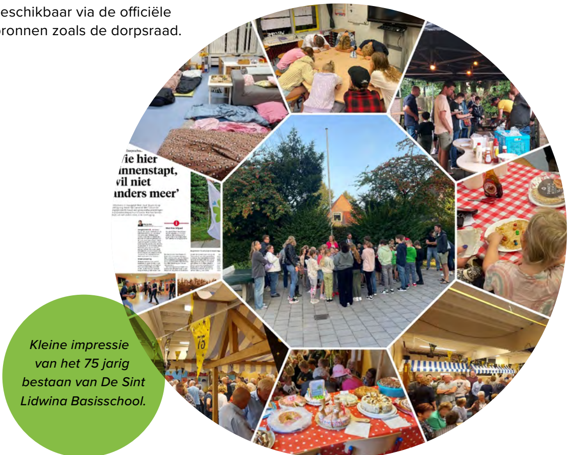
Kleine impressie van het 75 jarig bestaan van De Sint Lidwina Basisschool.

De dorpsraad zal hierin een belangrijke rol gaan spelen om de wensen van zowel de huidige bewoners als de nieuwe bewoners te realiseren. Waarschijnlijk zal er in 2025 gestart worden met overleggen met de school en met de gemeente wat de mogelijkheden zijn.