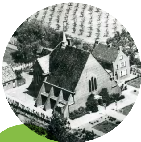
Kerk van Jacobus de Meerdere

De kerk werd in de loop van de jaren aangepast en uiteindelijk buiten gebruik gesteld vanwege veranderende behoeften in de gemeenschap. De overgang naar bewoning heeft ervoor gezorgd dat het gebouw behouden blijft, hoewel het niet langer een religieuze functie vervult.